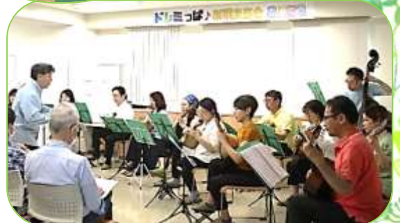
コントラバスやギターも。