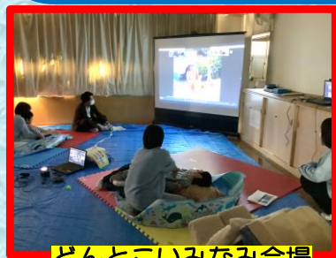
どんとこいみなみ会場