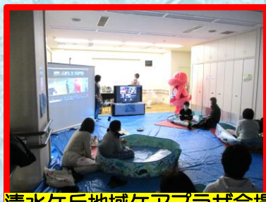
清水ヶ丘地域ケアプラザ会場